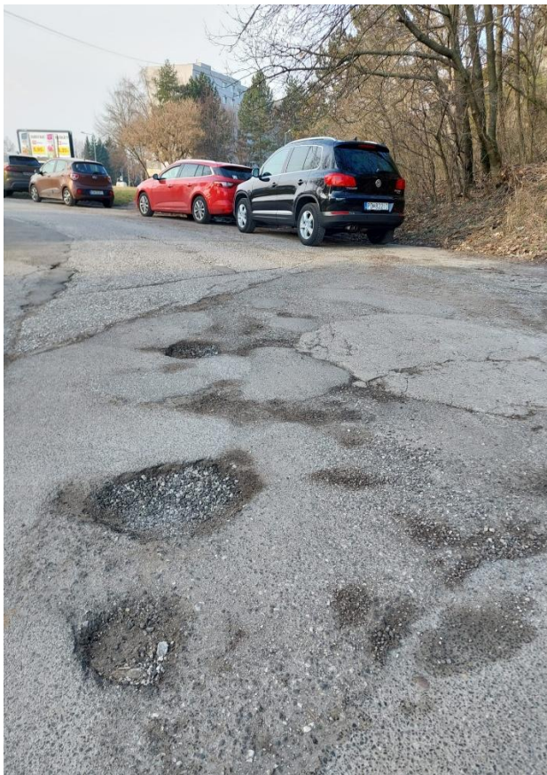
Príloha č. 1.