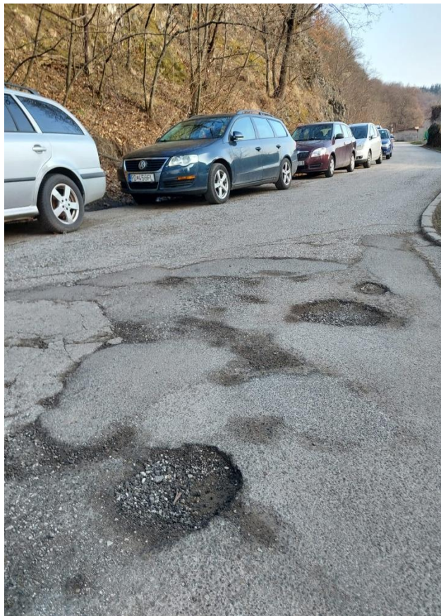
Príloha č. 2.