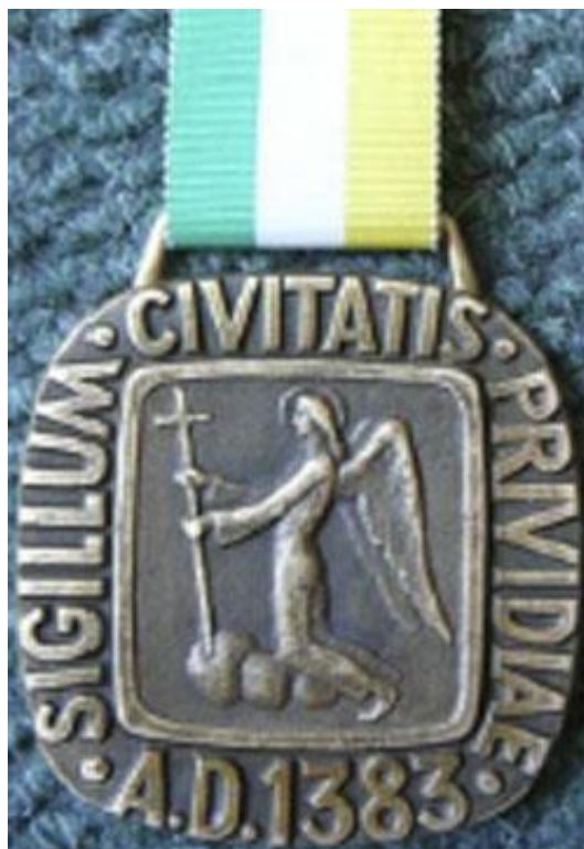
Príloha č. 12: Vyobrazenie poslanskej insígnie