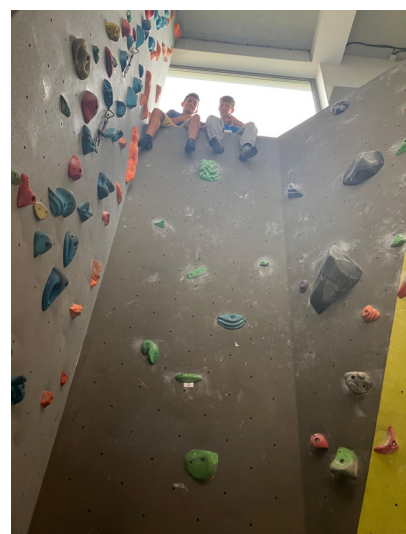
Fotografie: (1) Výstava Provitál (2) Varenie gulášu, (3) Aktivity v bazéne na kúpalisku Čajka, (4) Cvičenie v RM Sport Resort (5) Ďakovné listy od detí (6) Na lezeckej stene v RM Sport Resort

Chceme vám poďakovať RM Sport super stravový týždeň, vo vašej posilovni chcem aj pochváliť kuchárky ako nám dobre varieli oplat sa chodiť na duplex. Dobru som si ma cvičil. Mal som veľký strach na o horolezeckú stenu, báľ som sa rúspadnem ale animátorby mi dali odrahu a na koniec som vylietol, síce som báľ leť v podoví ale báľ to perfektný pocit. Čiže