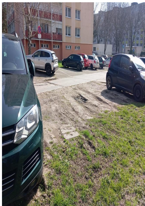
Príloha č. 11.