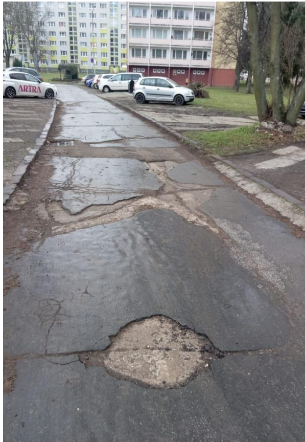
Príloha č. 12.