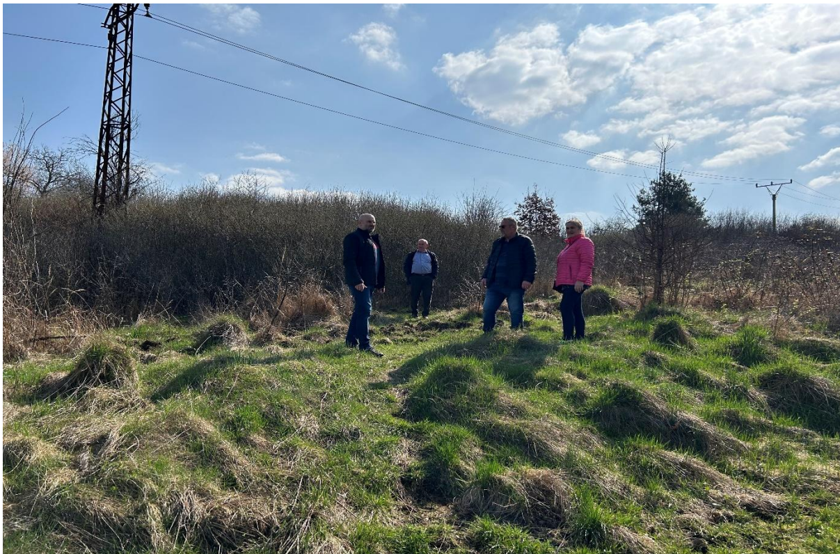
Príloha č. 15.