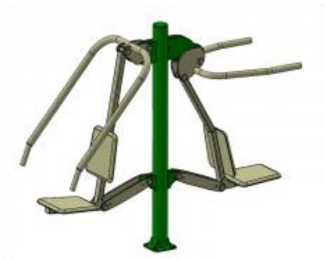
2319E Kombinovaný posilňovač – 1513,20€