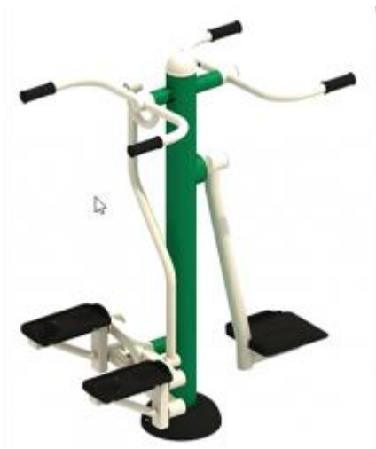
2021A Combined surf and stepper – 1117,20€