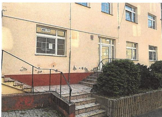
Obrázok č. 2 – fotodokumentácia