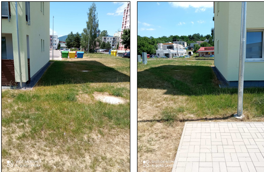
Obr. 2,3 Pohľad na riešené miesto

Riešené miesto sa nachádza v intraviláne mesta Prievidza v blízkosti novo postaveného bytového domu na Gazdovskej ulici. Pozdĺž bytového domu sa nachádzajú chodníky, ktoré ale nie sú prepojené so susednou Veľkonecpalskou ulicou. Šírky existujúcich chodníkov sa pohybujú v rozmedzí 1,5 – 2,0 m a sú vyhotovené z betónovej zámkovej dlažby.