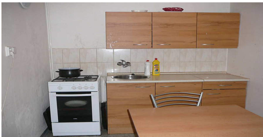
Kuchyňa - Zariadenie núdzového bývania