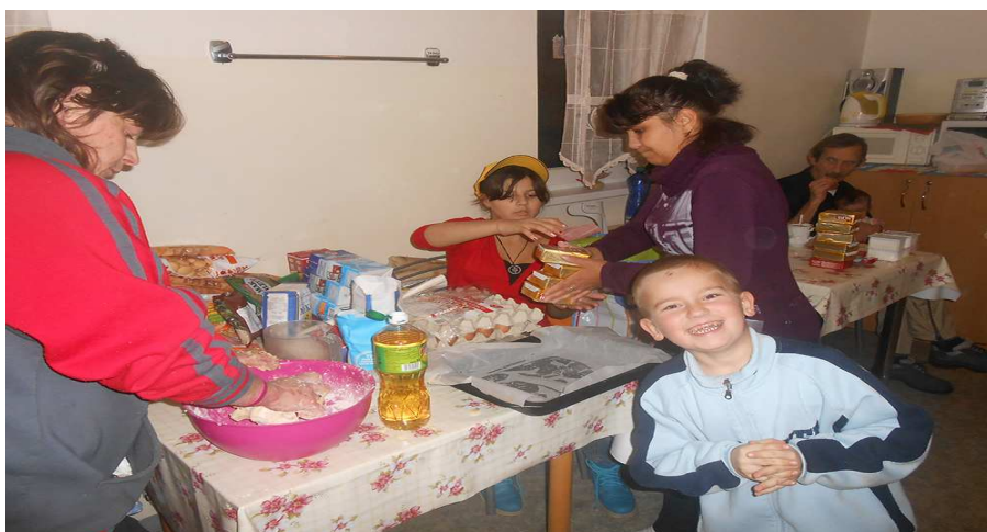
Vianoce – pečenie v Zariadení núdzového bývania