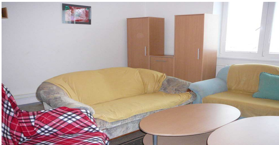
Interiér - Zariadenie núdzového bývania