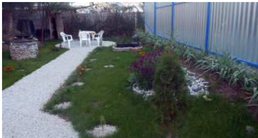
Záhroda - Útulok