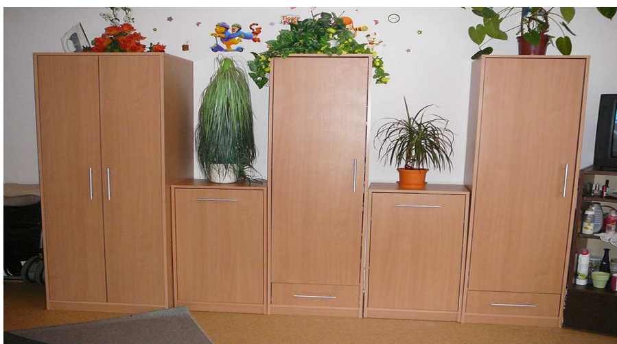
Interiér – Zariadenie núdzového bývania