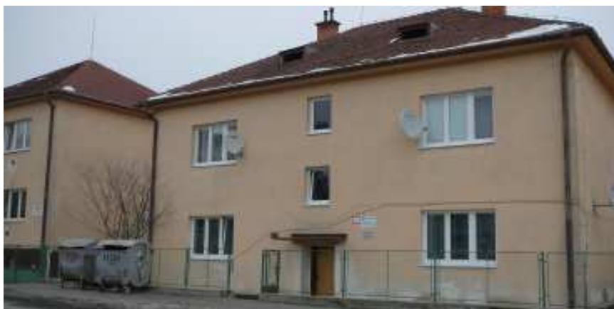
Objekt Útulku a Zariadenia núdzového bývania