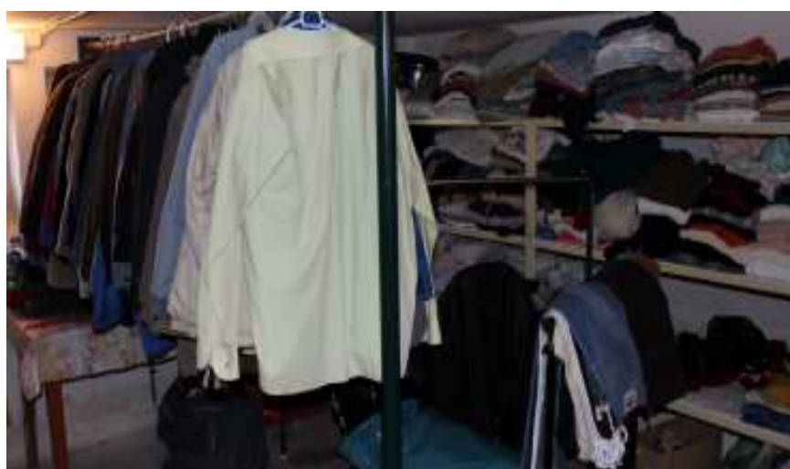
Odevná banka – Útulok