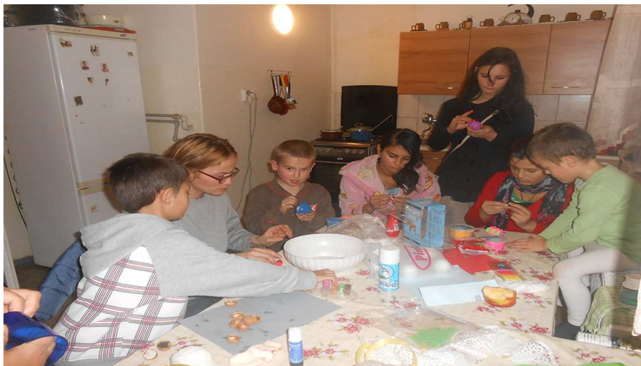
Výroba vianočných ozdôb – Zariadenie núdzového bývania