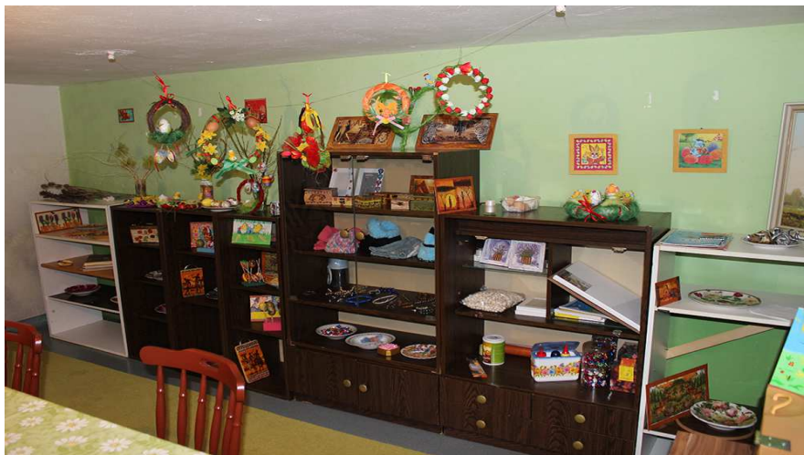
Časť interiéru dielne pre pracovnú terapiu – Utulok