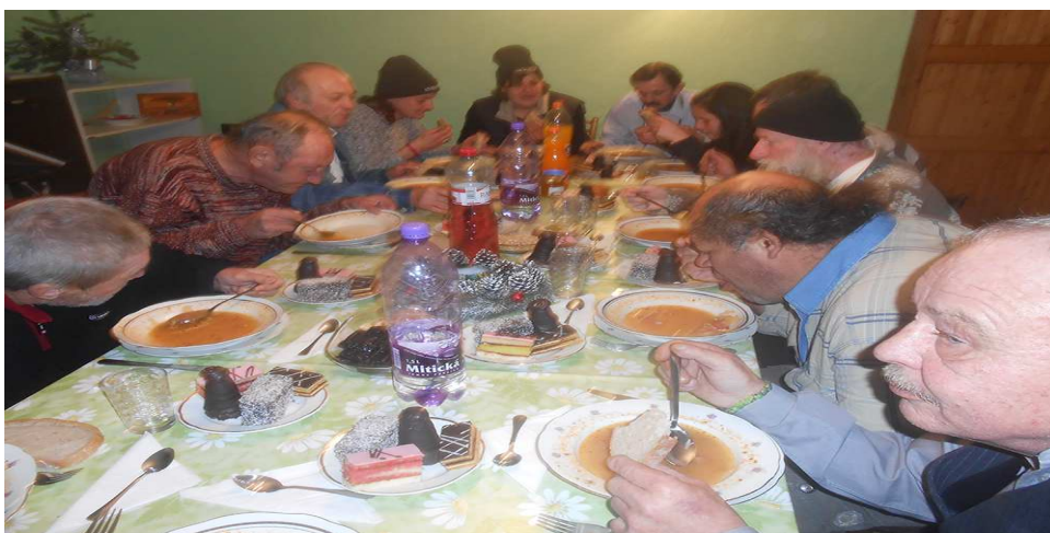
Štedrý večer - Útulok