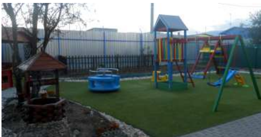
Detské ihrisko – Zariadenie núdzového bývania