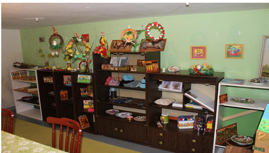
Časť interiéru dielne pre pracovnú terapiu