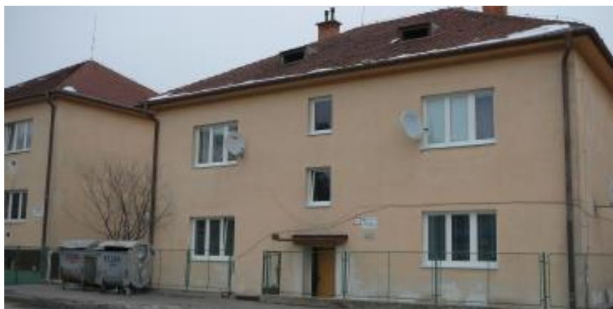
Objekty Útulku - Košovská cesta 15, 17