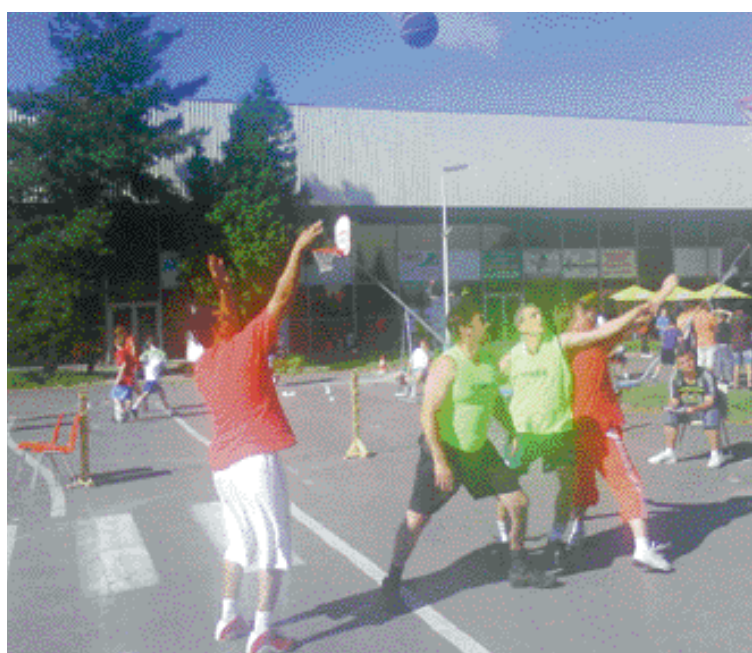
Ani rodičia sa nedali zahanbiť.