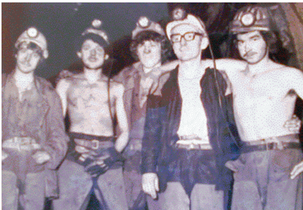
Ako majster odborného výcviku so svojimi zverencami v bani.