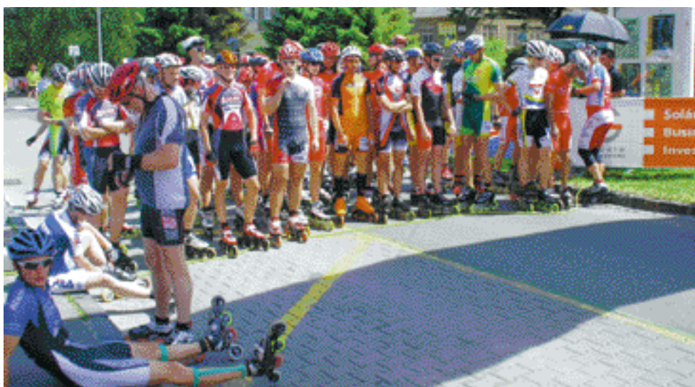
Muži na štarte.