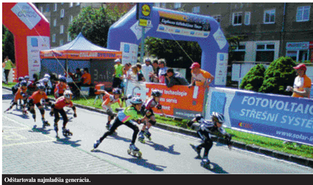
Odštartovala najmladšia generácia.