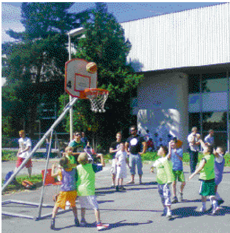
Najmladšie talenty v akcii.