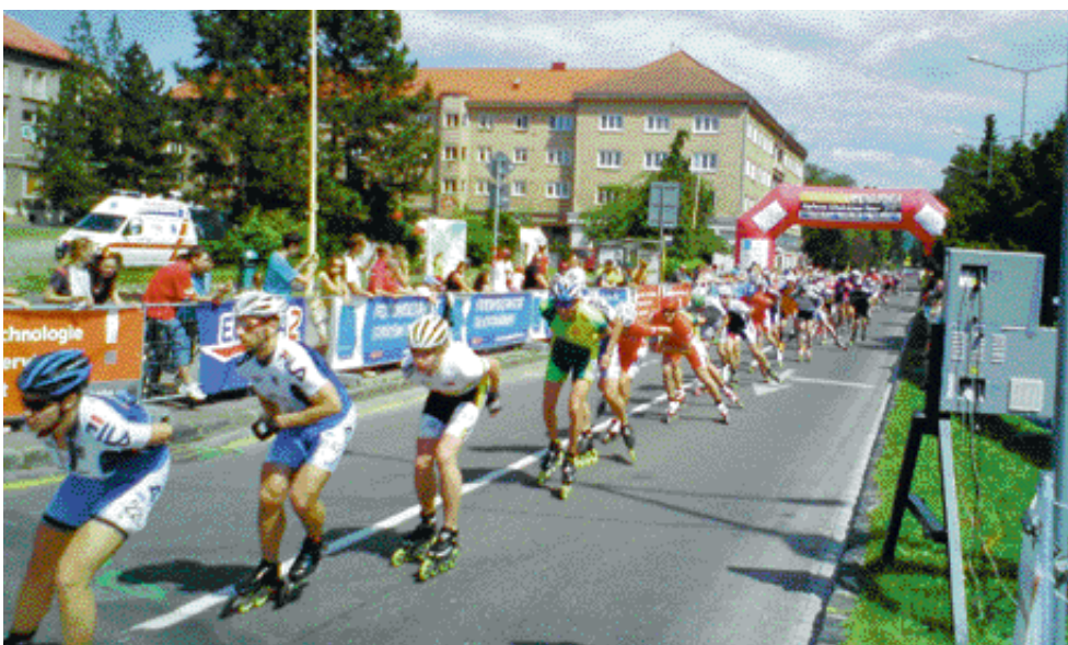
Nekonečný vláčik zo súťažiacich.

Jednosmerky na ulici M. R. Štefánika a prilahlý priestor námestia J. C. Hronského boli v prvú júnovú nedeľu centrom zaujímavého športového zápolenia fanúšikov kolieskových korčúľ. Po Prahe, Hradci Králové a Ostrave bola Prievidza hosťiteľom „in line“ korčuliarov nielen zo Slovenska, ale i Česka a Maďarska. Deti mali možnosť súťažiť na tratiach v dĺžke 1, 3 a 5 km. Dospelí v kategóriách mužov i žien mali šancu ukázať svoje schopnosti vo Fitness desiatke“ a štafetovom preteku (muž, žena a dieťa do 11 rokov). Pre tých najzdatnejších bola pripravená trať polmaratónu v dĺžke 21 km.