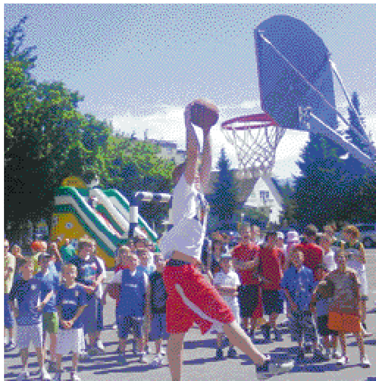
Súťaž v smečovaní.