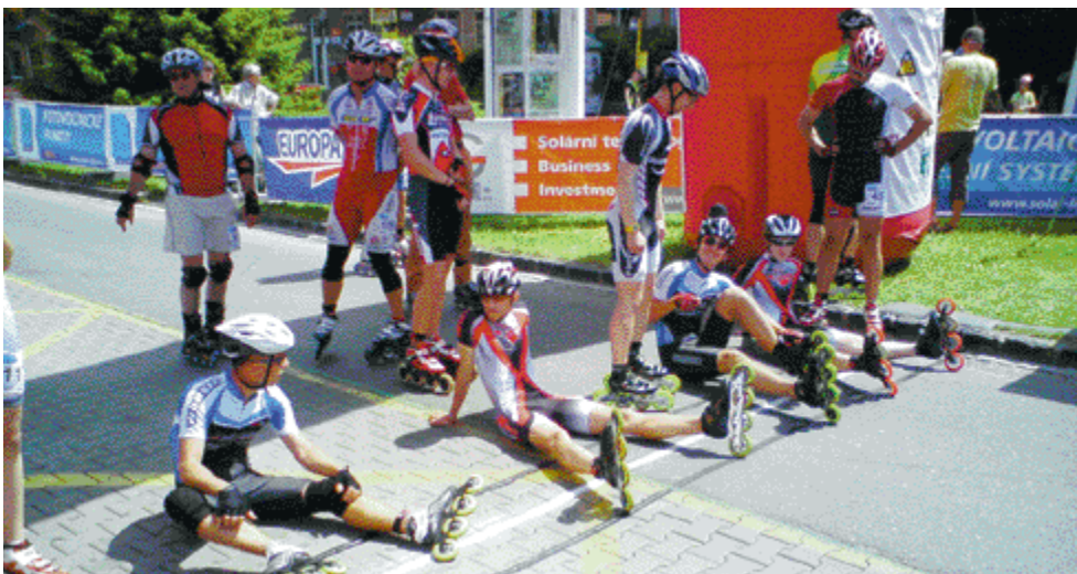
Čakanie na štartéra.