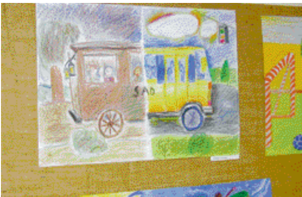
Deti kreslili vzhľad autobusov MHD...