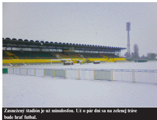
Zasnežený štadión je už minulosťou. Už o pár dní sa na zelenej trávě bude hrať futbal.

Zimná prestávka pre futbalistov je už minulosťou. Hráči a funkcionári FK Mesto Prievidza sa podobne ako ostatní športovci v našom regióne musia vyrovnávať s ťažkou finančnou situáciou. U futbalistov hrajú v prípravnom období dôležitú úlohu aj nie práve ideálne klimatické podmienky. Je jasné, že o sústredení na kvalitných terénoch niekde v zahraničí s ideálnou stravou a servisom, sa našim chlapcom môže tak nanajvyš snívať.