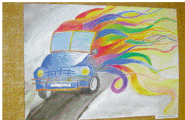
...ale aj to, akou rýchlosťou by sa mali pohybovať. V tomto prípade rýchlosťou vetra.