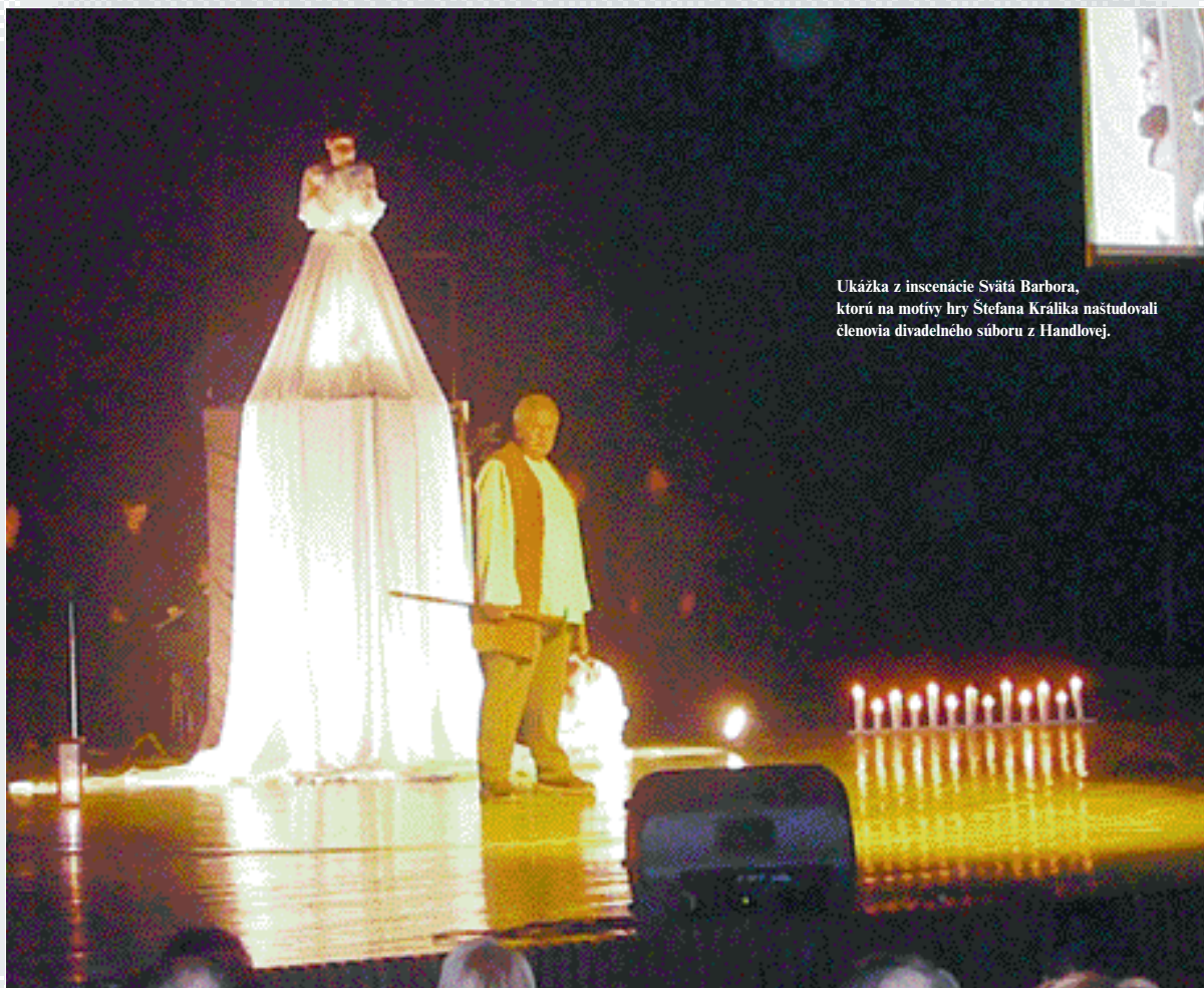
Ukážka z inscenácie Svätá Barbora, ktorú na motívy hry Štefana Kráľika našťudovali členovia divadelného súboru z Handlovej.